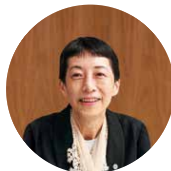
福岡看護大学 副学長 福岡看護大学大学院 研究科長

教職員が一丸となって院生の一人一人に応じた研究環境を提供し指導します。既存の知識を得るだけでなく、自ら創造し、これから大きく発展するこの新しい分野を切り開く進取の気持ちと好奇心を持って皆様と共に切磋琢磨できることを願っています。