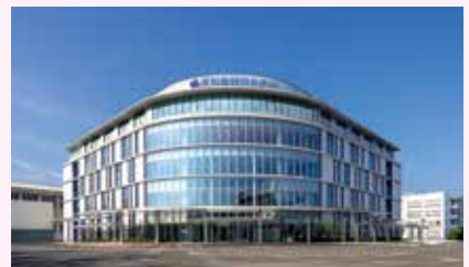
福岡歯科大学医科歯科総合病院