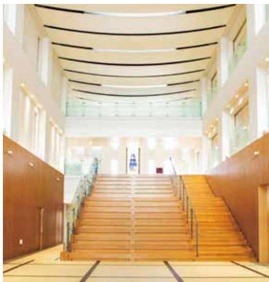
【エントランスホール／1F】