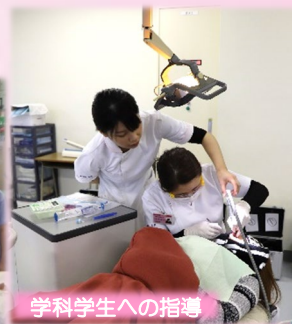
学科学生への指導