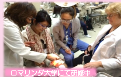
ロマリダ大学にて研修中