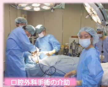
口腔外科手術の介助