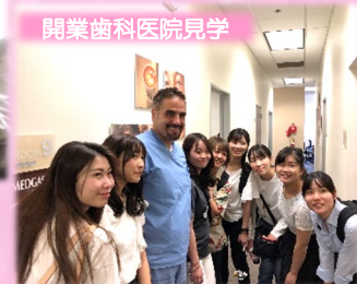
開業歯科医院見学