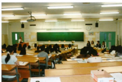
卒業生アドバイザーによるガイダンス

各学科の就職先である企業（職場）や職能団体（歯科医師会と介護福祉士会）の担当者と連携したガイダンスの実施により、個々の学生が企業（職場）等のニーズを把握でき、学生自らの就職のためのモチベーションや就業力を向上できるキャリア形成を促進させ、今後の就職支援の向上を図ります。