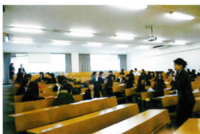
就活力・社会人カセミナー

当該学生の“先輩”にあたる、医療・福祉系企業（職場）で勤務する本学卒業生アドバイザーと連携したガイダンス・説明会の実施を通じて、個々の学生が企業（職場）における“生の声”を把握できます。