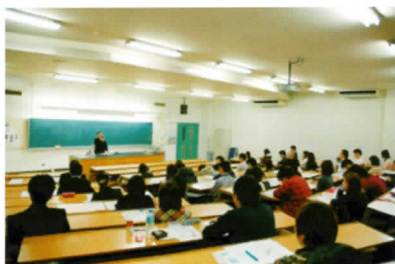
企業や職能団体によるガイダンス

各学科の就職先である企業（職場）や職能団体（歯科医師会と介護福祉士会）の担当者と連携したガイダンスの実施により、個々の学生が企業（職場）等のニーズを把握でき、学生自らの就職のためのモチベーションや就業力を向上できるキャリア形成を促進させ、今後の就職支援の向上を図ります。