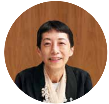
福岡看護大学 副学長 福岡看護大学大学院 研究科長

教職員が一丸となって院生の一人一人に応じた研究環境を提供し指導します。既存の知識を得るだけでなく、自ら創造し、これから大きく発展するこの新しい分野を切り開く進取の気持ちと好奇心を持って皆様と伴に切磋琢磨できることを願っています。