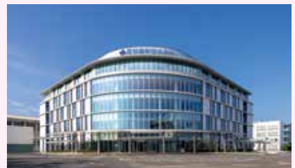
福岡歯科大学医科歯科総合病院