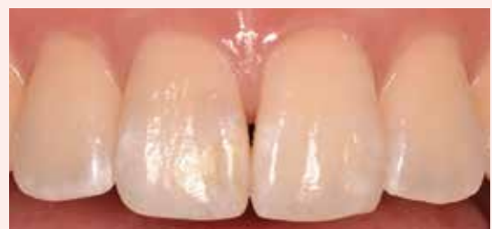
ホワイトニング後