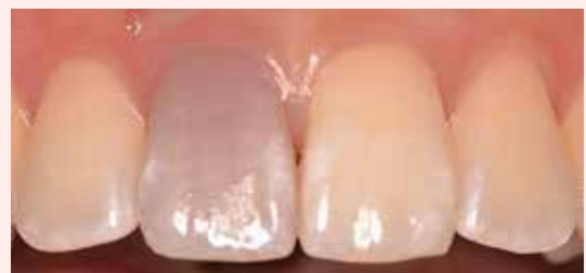
ホワイトニング前