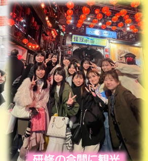
研修の合間に観光

専攻科についてのお問合せ 福岡医療短期大学歯科衛生学科入試係 〒814-0193 福岡市早良区田村2-15-1 ☎：092-801-0439 ✉：gakumuj@fdcnet.ac.jp