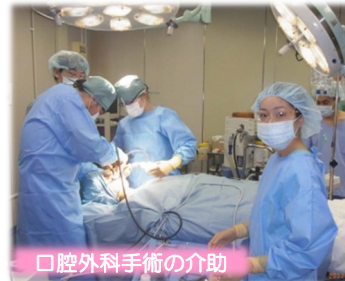
口腔外科手術の介助