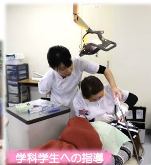
学科学生への指導