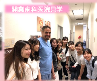
開業歯科医院見学

約2週間のホームステイ ロマリダ大学や開業歯科医院訪問、 ディズニーランド（アナハイム）、 ユニバーサルスタジオ（LA）観光や ショッピング 等