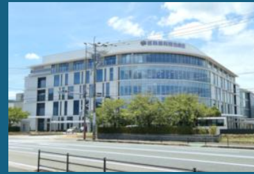
福岡歯科大学医科歯科総合病院

福岡歯科大学医科歯科総合病院 〒814-0193 福岡市早良区田村2-15-1 TEL: 092-801-0425 FAX: 092-801-4909