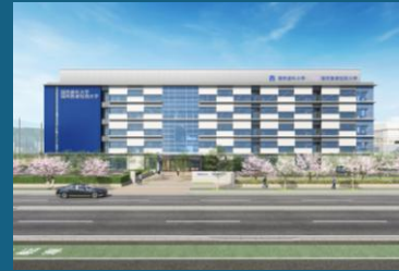
福岡歯科大学 本館