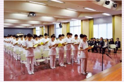
福岡医療短期大学登院式