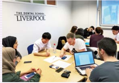
リバプール大学研修派遣