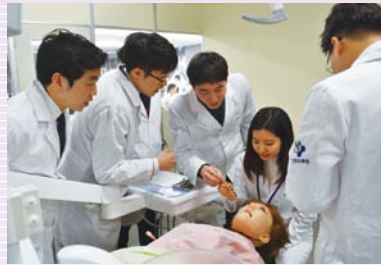
慶熙大 キョンヒ 学校歯科大学学生訪問団来学