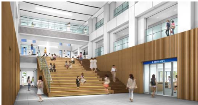
◆3層吹き抜けの爽やかなエントランスホール