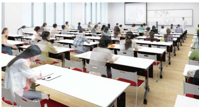
◆南に面した明るい講義室