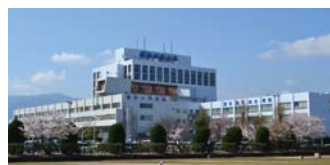
福岡歯科大学医科歯科総合病院