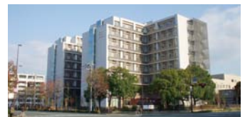
公立学校共済組合 九州中央病院