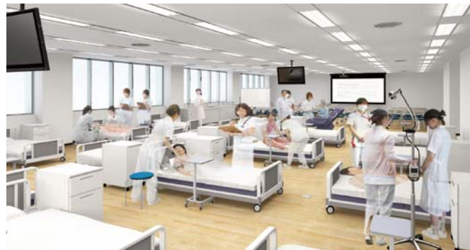
◆臨場感ある指導が受けられる看護実習室