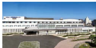
独立行政法人国立病院機構 福岡東医療センター