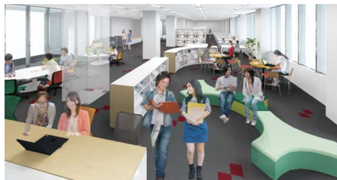
◆専門図書等が充実した図書館