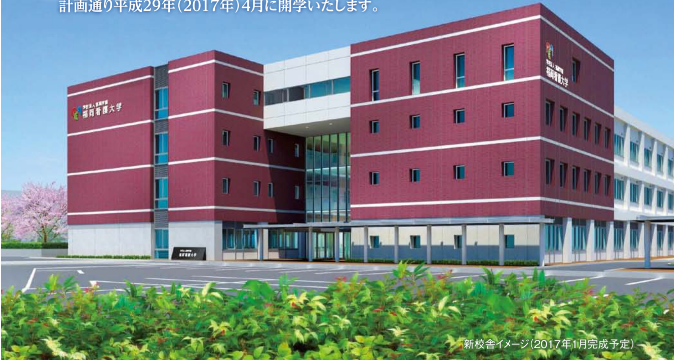
新校舎イメージ(2017年1月完成予定)

学校法人福岡学園が設置認可申請した「福岡看護大学」は、平成28年8月26日に文部科学省の大学設置・学校法人審議会から「可」の答申を受け、8月31日、文部科学大臣より設置が認可されましたので、計画通り平成29年（2017年）4月に開学いたします。