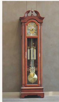
福岡歯科大学 同窓会寄贈品