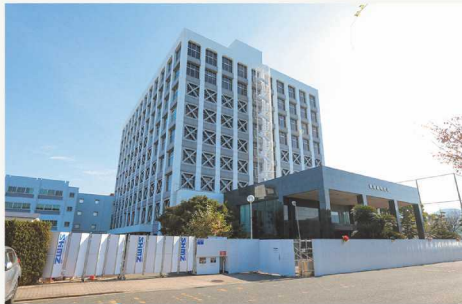
旧校舎 9階建ての学び舎は今年解体予定です。

新本館で迎える新しい一年が始まりました。語らいテラスなど学内の共用部をご紹介します。