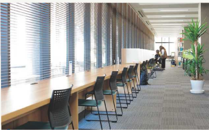
図書館 ガラス張りで明るく開放的な図書館は、勉強に集中しやすいように資料を広げて学修できる机、蔵書閲覧コーナーなど学修環境が整いました。