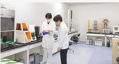
口腔医学研究センター 3～5階に5つの研究室がある本センターは、研究機器が揃い充実した研究環境を備えました。