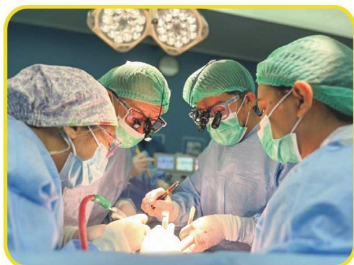
図2 肝右3区域切除+門脈切除・再建 (ミャンマー外科チームとともに)