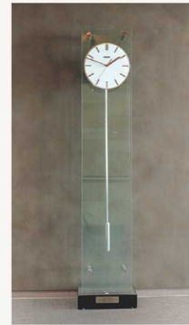
福岡医療短期大学 同窓会瑞樹会 寄贈品