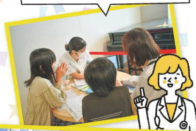
「地域とつながる口腔ケア」