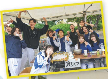
学園祭「田の歯科祭」