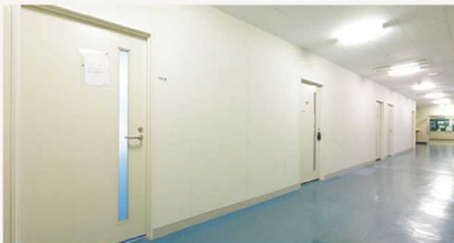
研究棟1階へ移った部室 MA部、ESS部、DTP部の部屋があります。