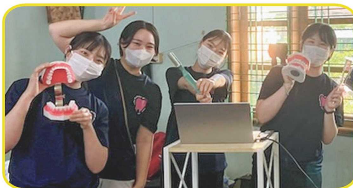
図1 集団歯科保健指導(Dream Trainにて)