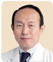
池邊 哲郎 (口腔外科学分野 教授)