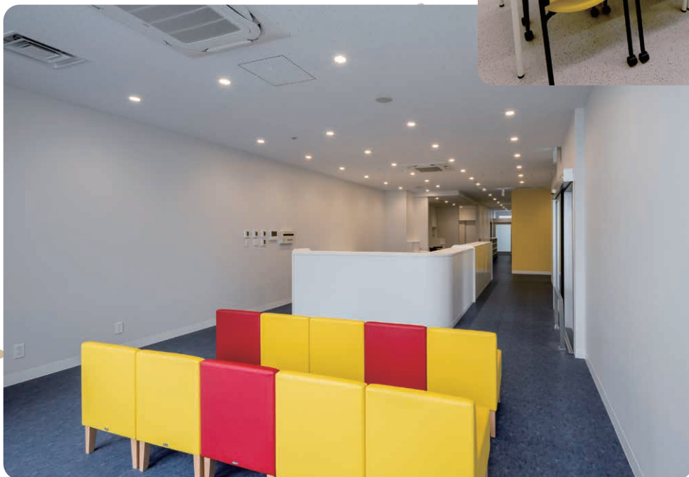
保健管理センター

学校法人福岡学園の学生と教職員の心身の健康の維持および増進を目的に、福岡歯科大学・福岡看護大学・福岡医療短期大学保健管理センターが2022年9月1日に開設されました。