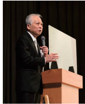
福岡歯科大学長講演