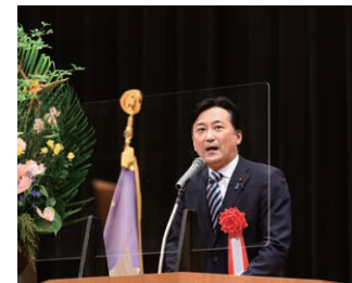
厚生労働副大臣 古賀 篤 様 ご祝辞