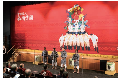
祝いでた・博多手一本(博多祇園山笠振興会 様)