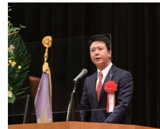
福岡市長 高島 宗一郎 様 ご祝辞