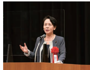
記念講演(比嘉 奈津美 様) (参議院議員/福岡歯科大学8期生)