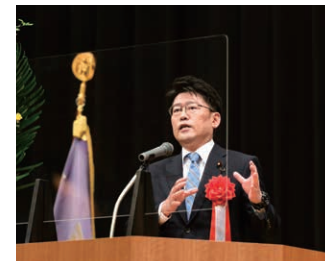
防衛副大臣 鬼木 誠 様 ご祝辞