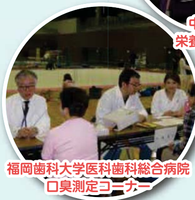
福岡歯科大学医科歯科総合病院 口臭測定コーナー

身体への負荷が少なく、効率良く続けやすい有酸素運動として今注目のスロージョギング ® を、専門の講師の指導のもとで体験してみませんか？ 体力に合わせた30～40分程度のウォーキング等の運動から話題のスロージョギングの実践まで、楽しみながら体験することができます。 その他、栄養相談、血圧測定、口臭測定のコーナーや、健康的な食生活とオーラルケアのヒントを学べる講座など、健康に役立つ情報が盛りだくさん。ぜひお気軽にご参加ください。