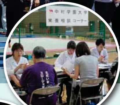
中村学園大学 栄養相談コーナー