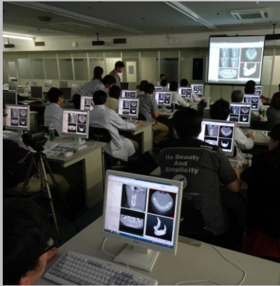
口腔インプラントの画像診断