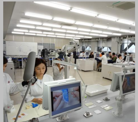
上部構造の作製方法