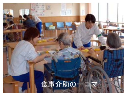
食事介助の一コマ

その結果、「実習は有意義であった」と答えた学生が88.5%を占め、「実習にとっても満足」あるいは「満足」と答えた学生が95.8%を占めていました。