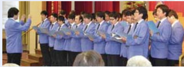
校歌を紹介するグリークラブ

継者であり、本学の未来は、皆さんの一人ひとりの豊かな創造性と、堅固な哲学性と、無限の可能性に委ねられています。一人ひとりの研究を通じて、人格を磨くとともに、科学の発展の一翼を担ってください。」と式辞を述べました。