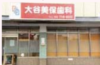
私が働けるのは、本当にスタッフ、家族のおかげです。感謝。感謝。

ただ、日曜の度に講習会に行き、平日も朝から夜までの仕事で、子供には寂しい思いをさせています。少しは家庭も省みなければと反省しています。