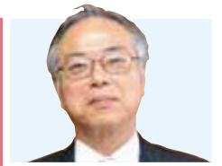
廣藤 卓雄 (総合歯科学分野・教授)