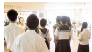
保健福祉学科・介護施設見学