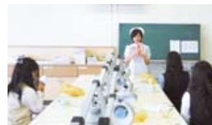
歯科衛生学科・歯磨き体験