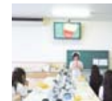
歯科衛生学科:歯磨き体験