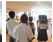
保健福祉学科:介護施設見学