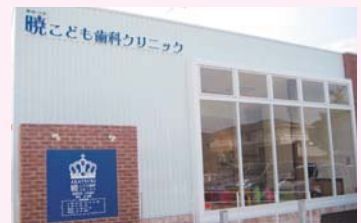
オープンな診療スペースにこだわったクリニック。

ちと接しているか見ることが出来るので安心という意見も頂けているので嬉しくも思います。また、自分自身もそうですが、スタッフにとっても、常に見られているという緊張感の中で仕事をすることが多いと思います。自分自身もまだまだ未熟なので今はスタッフと共にいかに多くの子どもの歯医者に対する恐怖心や抵抗感がオープンな形であることと自分たちの対応によって少しでも和らいでもらえるよう小さなことでもスタッフ全員で考え、話し合いをするようにしています。