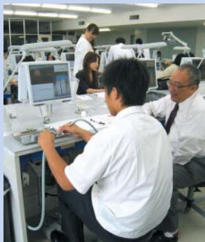
模擬実習「歯をきれいにしてみよう」

模擬実習の様様や参加者の声(アンケートより)などをホームページに掲載しておりますので是非ご覧ください。