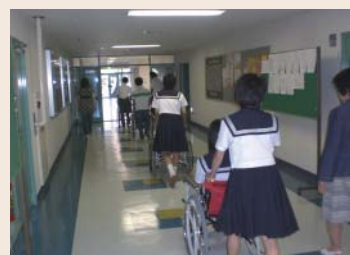
保健福祉学科:車椅子体験

福岡医療短期大学では、10月以降も「オープンキャンパス」を下記の日程で行います。お誘い合わせの上、お気軽にご参加下さい。 (問い合わせは各入試係まで)