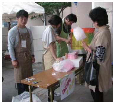
近郊の福祉施設でバザーのお手伝い

○学友会総務委員会が中心となって企画立案や施設との交渉を行い、ボランティア活動を実施しています。今年度は、大学と同一キャンパス内にある2つの介護老人保健施設・介護老人福祉施設や近郊の施設を訪問し、様々な行事のお手伝いや利用者の方との交流を行いました。年間を通じて継続的に活動することを目標に、学生主体で取り組んでいます。本館学生ホールには参加申込ボックスを設置して参加学生の募集をしています。