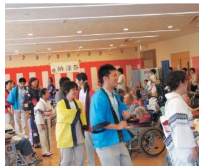
みんな楽しく輪になって総踊り

介護老人保健施設サンシャインシティの納涼祭が8月3日に行われました。マジック・ショーやのど自慢、総踊りなどが披露され、利用者やご家族、ボランティアの方々や職員などが多数参加し、楽しい一時を過ごしました。