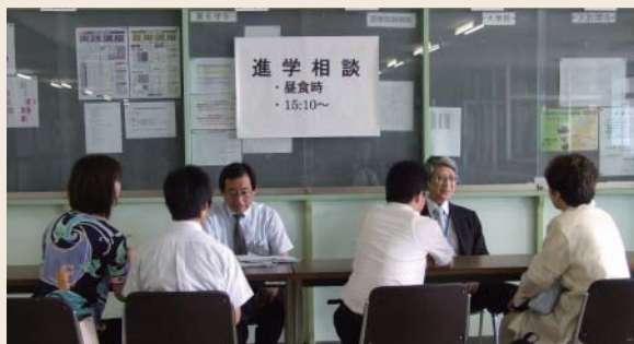
希望者による個別進学相談

大学では、模擬授業『子どもの歯並びができる仕組み』や模擬実習『指の模型を作ろう』『DNAの析出と酵素分解』および教員や在校生を交えた昼食会が行われました。