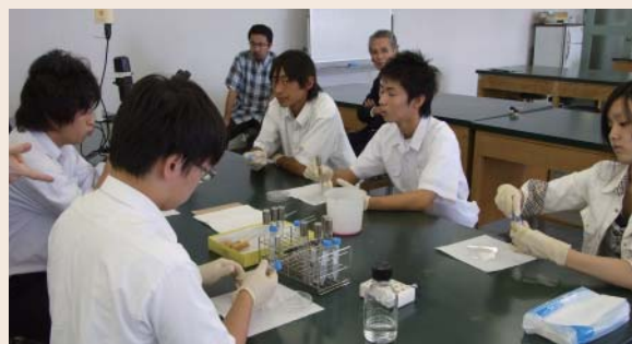
模擬実習『DNAの析出と酵素分解』