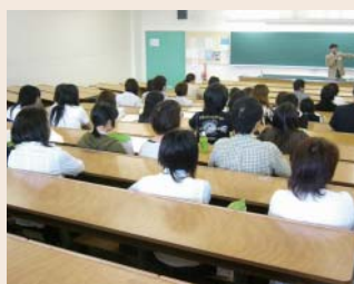
歯科衛生学科:学科内容について説明

短大では学園内施設見学のほか、歯科衛生学科の参加者は歯科診療実習室・マネキン実習室見学、保健福祉学科の参加者は手話ソングや車椅子体験などが実施され、在学生から受験生への受験メッセージ発表も行われました。