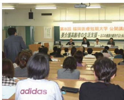
参加者からの質問を受ける講師たち

9月28日、福岡医療短期大学307教室において、第8回福岡医療短期大学公開講座「要介護高齢者の生活支援～お口の健康を維持するために～」が開催され、156人が参加しました。歯科医師、介護福祉士、歯科衛生士の異なった立場から介護現場の現状が理解できるもので、討論も熱心に行われました。