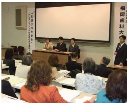
参加者の質問に回答する講師たち

9月20日、福岡県歯科医師会館において福岡歯科大学公開講座「笑顔は口元から～アンチエイジングのための美容歯科～」が開催され、美容歯科の視点から補綴・矯正歯科・ホワイトニングに関して3人の講師による講演が行われました。参加者から多くの質問があり、盛況のうちに終了しました。