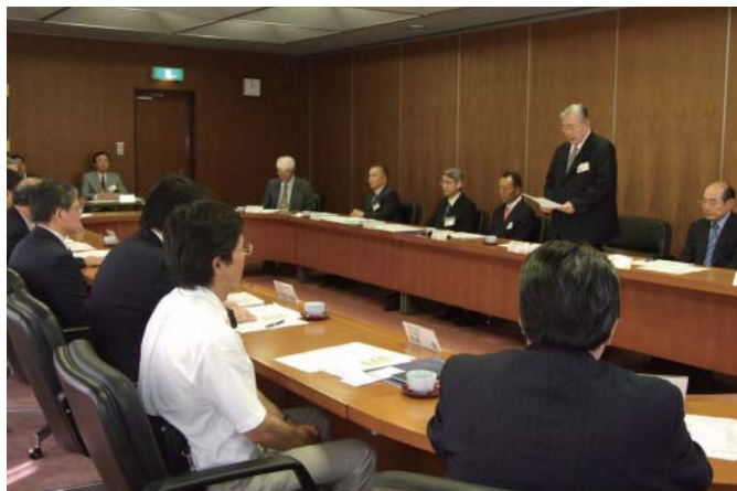
第1回連携大学学長・学部長会議(福岡歯科大学)

し、各大学における教育研究資源を有効活用することにより、当該地域の知の拠点として、教育研究水準のさらなる高度化、個性・特色の明確化、大学運営基盤の強化等を図ることを目的としています。