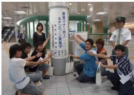
地下鉄 乗車マナー向上キャンペーン(賀茂駅)に参加した歯学部学生たち

○その他、学術文化部会のミュージック・アソシエーションが地域の夏祭りに出演、ラグビー部は福岡市の「地下鉄 乗車マナー向上キャンペーン」に参加しました。