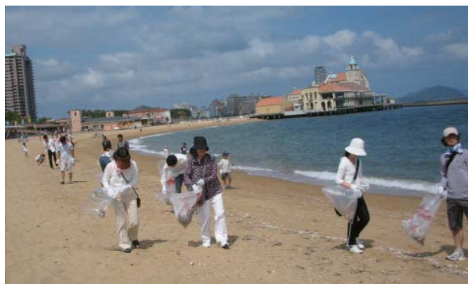
海岸清掃(ラブアース・クリーンアップ)

○さらに保健福祉学科では、今年度から、学生間で「レクボラの友」というサークルができ、定期的に活動について話し合いをもつようになりました。また、ラブアース・クリーンアップ(市民、企業、行政が協力して、河川、海岸などの散乱ゴミを回収する地域環境美化活動)や、福岡市の取組のひとつ、「地下鉄 乗車マナー向上キャンペーン」にも毎年学生と教職員が参加しています。