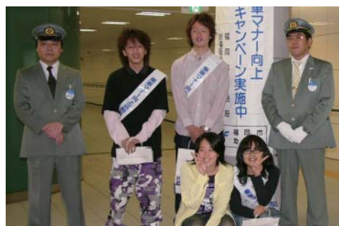
地下鉄 乗車マナー向上キャンペーン(次郎丸駅)に参加した短大学生たち