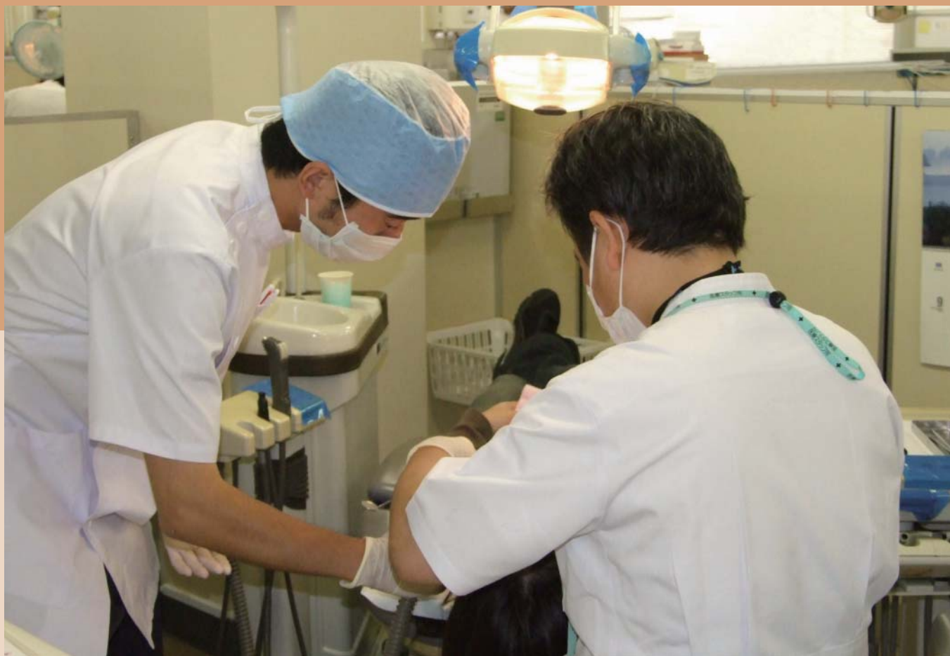
福岡歯科大学 医科歯科総合病院で臨床実習中の歯学部学生(左)