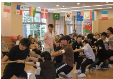
学生が参加した介護老人保健施設サンシャインシティの運動会