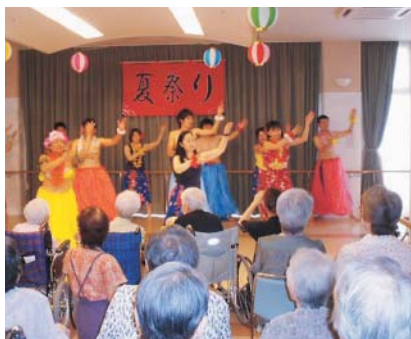
職員のみごとなフラダンス

7月27日、介護老人福祉施設サンシャインプラザで第5回夏祭りが1階地域交流スペースで開催されました。利用者やボランティア、職員による演芸、バザーやボールつり、輪投げなどが行われ、夏の暑さを一時忘れさせるほどの、大盛会となりました。