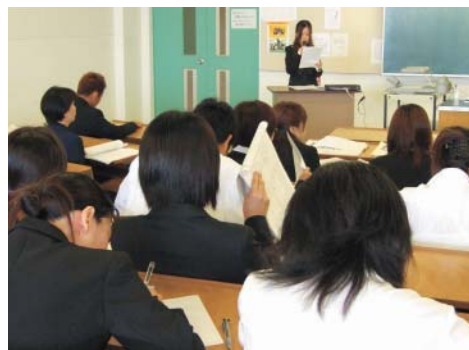
報告発表する学生

7月10日、福岡医療短期大学305教室で保健福祉学科2年生の実習報告会が行われました。報告者は、老人保健施設等のそれぞれの施設で担当した入所者の方が自分の作ったケアプランにより状態が改善されたことやその経緯を報告し、介護実習では入所者の方と会話することが大切であるとコミュニケーションの重要性を実感したこと等を発表しました。