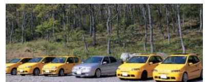
みんなでキャンブツーリングに行きました。